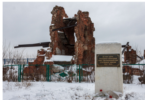
Окончание на 7-й стр.

В ПРЕДДВЕРИИ великого праздника – 75-летия Сталинградской Победы казаки по давней традиции пришли почтить память участников легендарного сражения на мемориальный комплекс «Остров Людникова» в поселке Нижние Баррикады города Волгограда. Здесь каждый год на протяжении многих лет Волгоградский казачий округ проводит митинг Памяти.