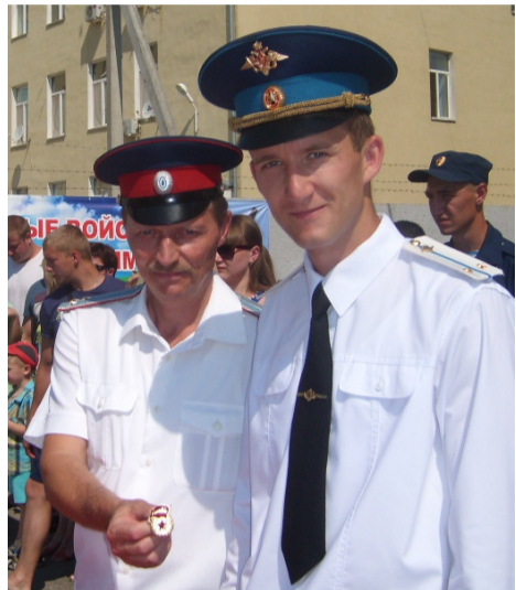
Принявшим присягу были вручены значки гвардейцев

56-ю отдельную гвардейскую десантно-штурмовую бригаду, которая воевала в Афганистане с декабря 1979 по июнь 1988 года. В 1990 году бригада выполняла специальные задачи в условиях чрезвычайного положения по поддержанию порядка в городах Баку, Мегри, Ленкорань, Кюрдамир Азербайджанской ССР, а также Ошской области Киргизской ССР. Постановлением Правительства Российской Федерации 22 апреля 1994 года бригаде присвоено почетное наименование Донская казачья. В период с декабря 1994 года по ноябрь 2004 года личный состав бригады участвовал в контртеррористических операциях в республике Чечня. С 1998 года по настоящее время бригада дислоцируется в городе Камышин Волгоградской области.