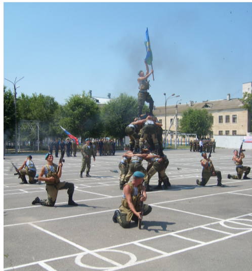
Свое боевое мастерство продемонстрировали бойцы взвода разведки