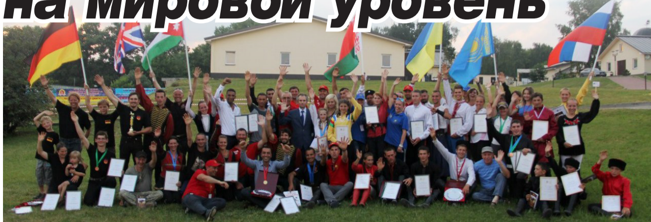
Участники Чемпионата мира по джигитовке. 2016 год