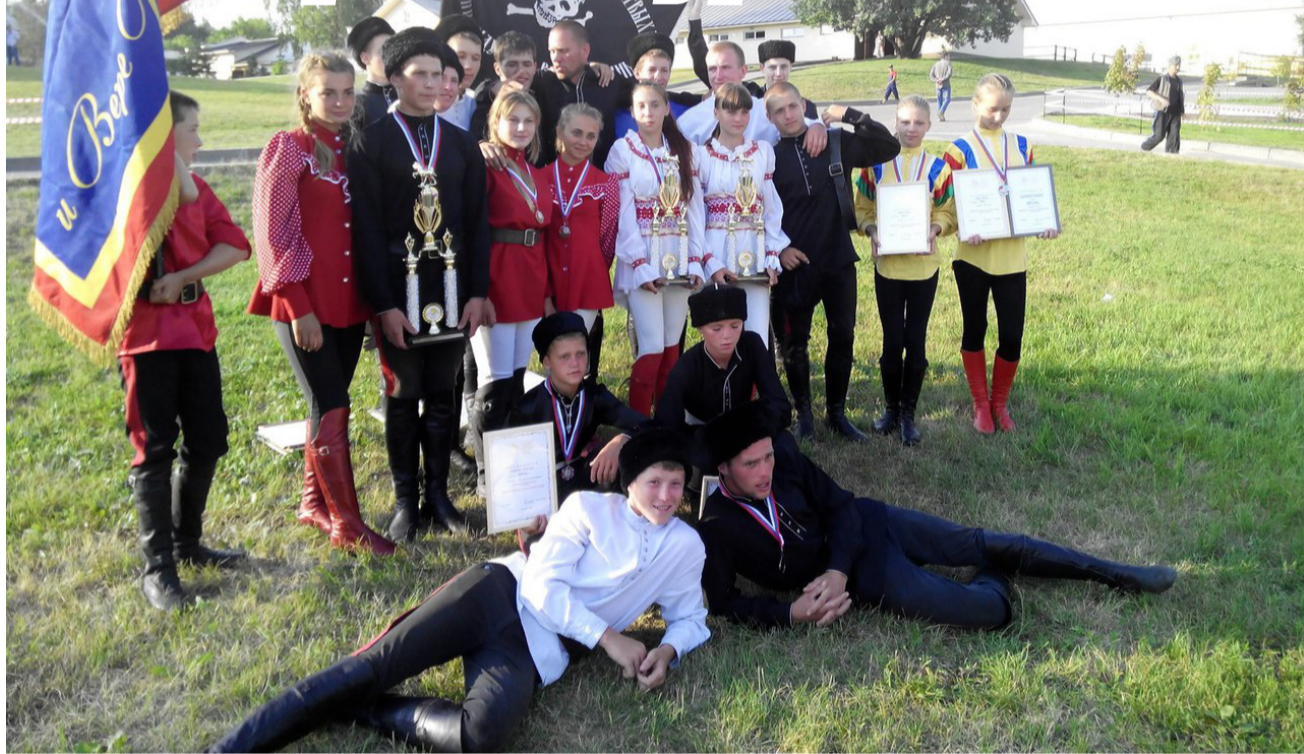
Команда Волгоградской области на Чемпионате мира по джигитовке. Город Лыткарино, Московская область. 2016 год

В подмосковном Лыткарино состоялись чемпионат России и первый в истории Чемпионат мира по джигитовке, проходившие на базе конноспортивного комплекса «Созидатель».