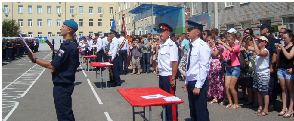
Воинская присяга молодых бойцов-десантников

Образована она была 5 января 1945 года и является правопреемницей 351-го гвардейского посадочного воздушно-десантного полка 106-й гвардейской воздушно-десантной дивизии. В годы Великой Отечественной войны полк участвовал в боевых действиях в Венгрии в составе 3-го Украинского фронта. В 1979 году он был реорганизован в