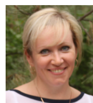
Рубрику ведет Светлана ЖДАНОВА

Л ето – пора овощей, фруктов и ягод. И, конечно же, надо пользоваться всем этим витаминным изобилием. Предлагаю вкусные, полезные и оригинальные блюда к вашему летнему столу.