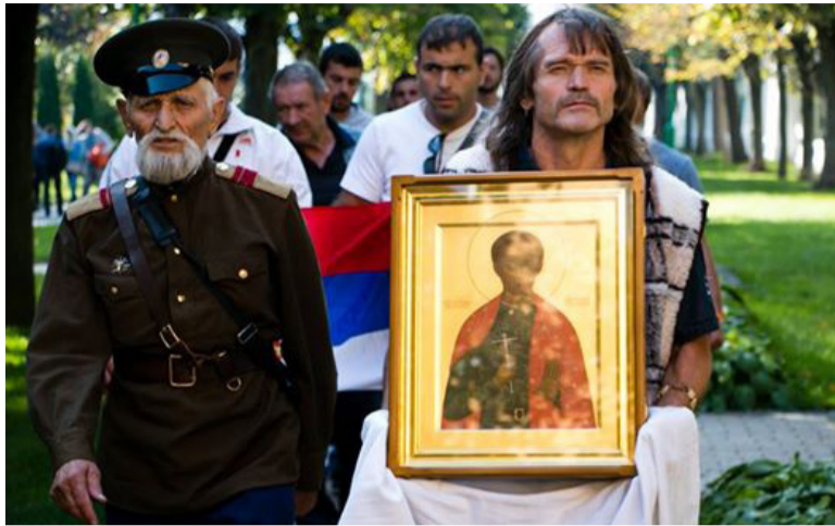
Отец и сын с сербами из Косово. Крым. 2014 г.

Ты, отец, всегда воспитывал нас, детей, своим личным примером. Никогда не забуду, как однажды летом, когда мне было лет пятнадцать, ты собрал нас, троих твоих чад, - я был старшим, и сказал: «Ребята, кубинская револю-