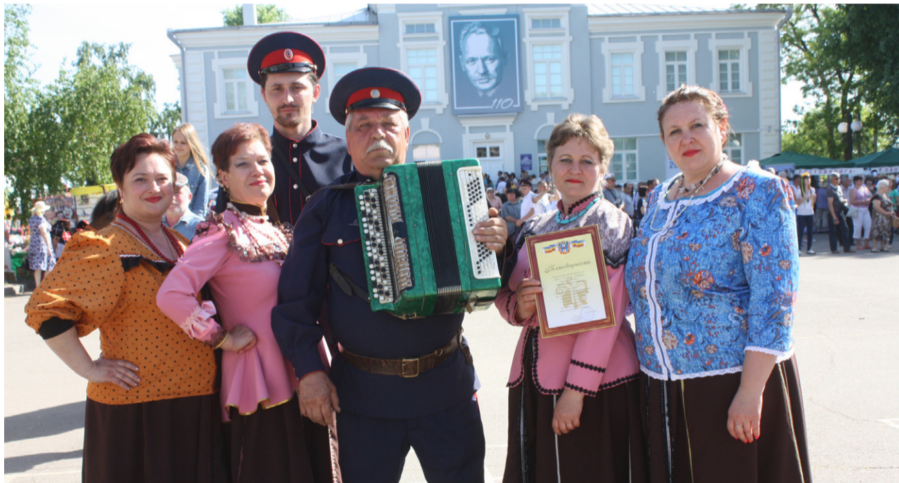
Казачий коллектив «Маков цвет» - лауреат Всероссийского фестиваля «Шолоховская весна»

В городе Серафимовиче и хуторах Усть-Медведицкого юрта работают несколько десятков коллективов художественной самодеятельности. Тринадцать из них носят звание народных.