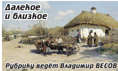
Рубрику ведёт Владимир ВЕСОВ

СКОЛЬКО ЖЕ за последние 25 лет возрождения казачества появилось на земле волгоградской хуторов и станиц! Вот лишь некоторые из них: Никольская, Волго-Донская, Августовская, Рождественская, Воскресенская, Благовещенская, Крещенская, Казачья, Вознесенская, Петропавловская, Державная, Константиновская... Какие красивые названия. Да жаль, все они не натуральные, а искусственные, и обосновались на терри-