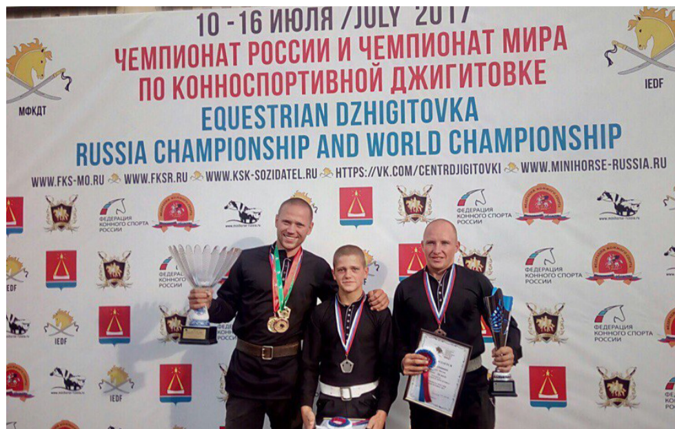
Счастливая минута награждения

В рамках Чемпионата Мира был включен отдельный зачет для женщин. Те страны, где в составе сборных нет женщин,