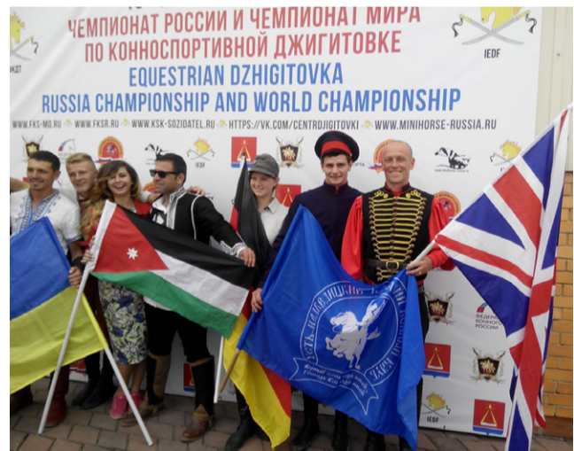
Усть-Медведицкие казаки на Чемпионате Мира по конноспортивной джигитовке 2017 года