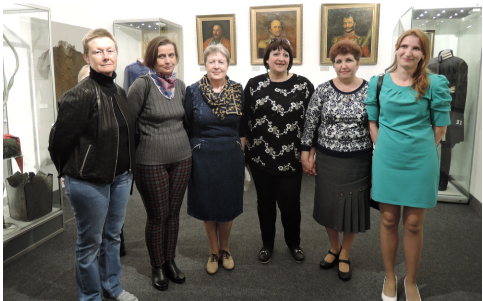
Организаторы выставки «На страже Отечества»

Известный донской историк 19 века В.Д. Сухоруков, написавший исследование о Черкасске, считал, что городок воз-