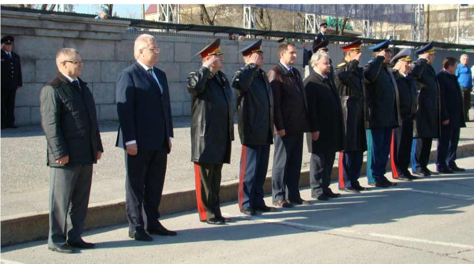
Окончание. Начало на 1-й стр.

Состоялось торжественное построение командиров и личного состава ГУ МВД России по Волгоградской области, войск национальной гвардии, курсантов Волгоградской академии МВД России, представителей казачьей муниципальной дружины и добровольных народных дружин, учеников