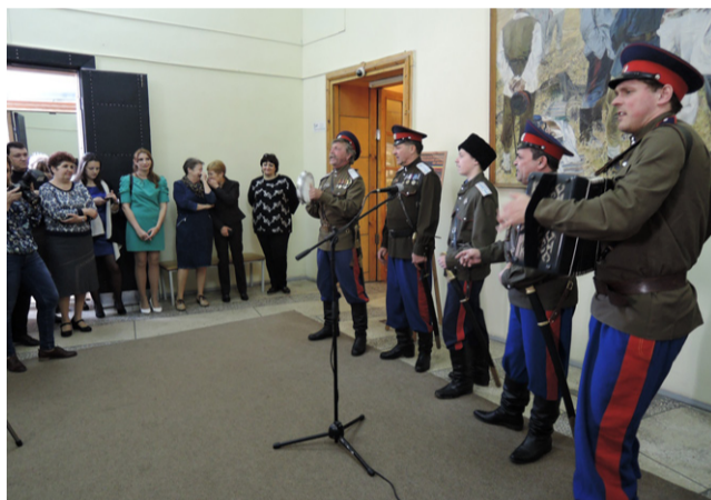
Народный мужской фольклорный ансамбль казачьей песни «Братья»

ник «не ранее как или в самом исходе 16 столетия или в начале 17-го». Другая версия основания Черкаска приводится в «Словаре географическом Российского государства», где сказано о том, что запорожцы, помогавшие Ивану Грозному в покорении Астрахани, в 1570 году основали Черкасск. Нет единого мнения среди историков и в вопросе о происхождении названия самого города. В. Сухоруков, А. Ригельман и В. Броневский считали, что Черкасск получил свое название от поселившихся тут казаков-запорожцев, то бишь, черкас. Как бы то ни было, сегодня станица Старочеркасская – это легенда Дона, а многочисленные экспонаты старины глубокой поистине уникальны.