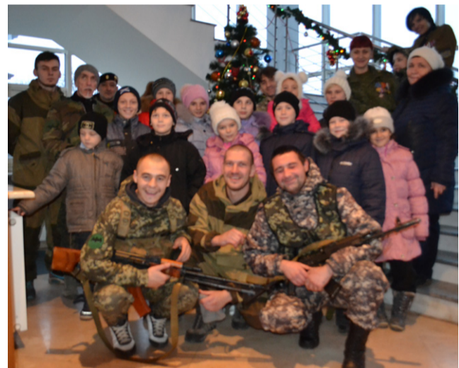
У новогодней ёлки с детдомовцами

В декабре 2015 года мы поместили в газете «Казачий Круг» призыв о сборе новогодних подарков для детей воинов Донбасса, а также различного рода продуктов питания. Совместными усилиями нам удалось собрать около трёхсот комплектов новогодних подарков (стоимостью в 300 рублей за комплект). Кроме того, мы собрали 15 мешков продуктов (мука, крупа, макароны). В начале следующего 2016 года нам удалось весь этот груз привезти в Донецк. А конкретно – в разведбат особого назначения, где подарки распределены между детьми военнослужащих (в том числе погибших). Кроме казаков Берёзовского юрта активное участие приняли казаки Котовского, Ольховского, Фроловского, Михайловского и Усть-Медведицкого юртов, а также отдельные общества Волгоградского казачьего округа.