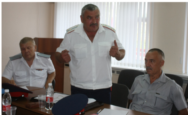
На Совете атаманов округа обсуждалось много насущных вопросов