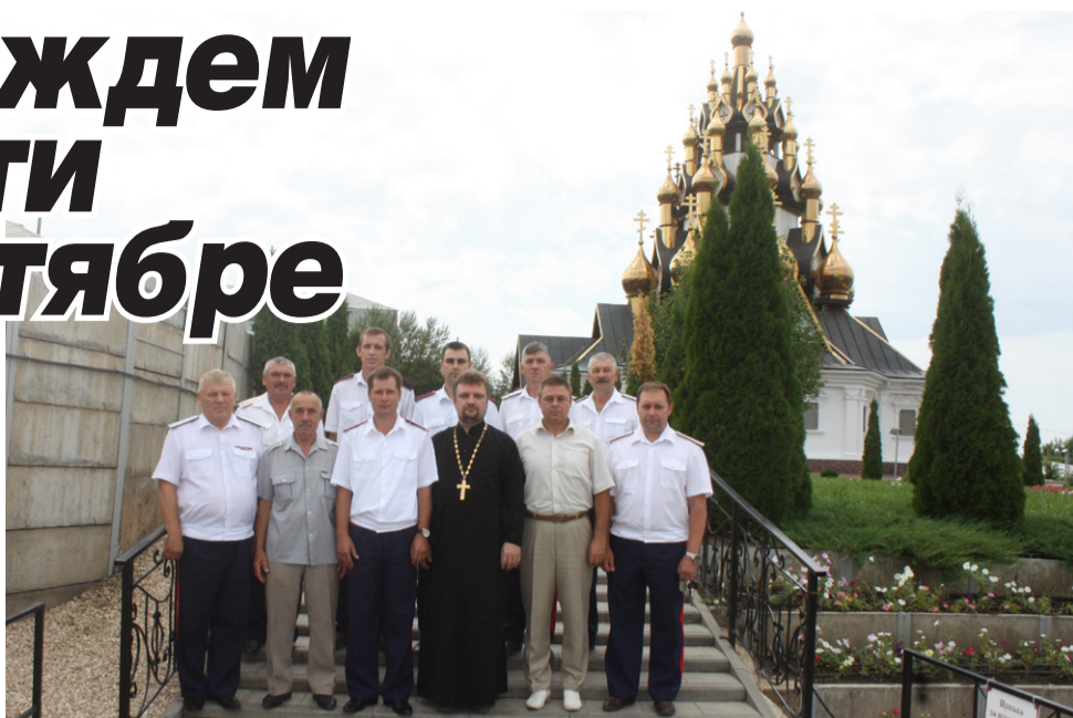
Участники Совета атаманов Усть-Медведицкого казачьего округа

Необходимость включения казачьих обществ в государственный реестр крайне важна. Ведь это, по сути, основополагающий документ, который определяет направления взаимодействия российского казачества с органами власти. Только так казачьи общества могут рассчитывать на предоставление им от государства ряда преференций. В том числе – на получение бюджетных средств для выполнения государственных задач, таких как