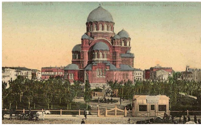
Александро-Невский собор в Царицыне