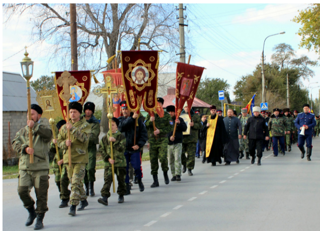
Казаки и кадеты Второго Донского казачьего округа прошли Крестным ходом по улицам Калача-на-Дону – города воинской славы