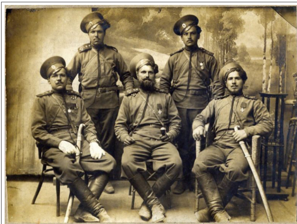
За что сражались эти донские казаки – Герои Первой мировой? Снимок 1915 года

К примеру, несколько наших первичных обществ организовали юртовое (районное) казачье общество в качестве учредителей. И это юртовое общество не может командовать или управлять своими учредителями. А вот учредители могут в любой момент ликвидировать юртовое общество, если захотят. В уставе нашего хуторского общества нет ни слова о юртовом обществе (которого и не было на момент реги-