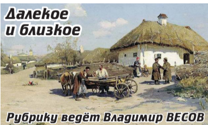
Далекое и близкое