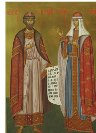
Благодарны князь Петр и княгиня Феврония – покровители семьи и брака. Их брак многие века является образцом христианского супружества

Сегодня, 8 июля, в Лебяжинском сельском поселении Камышинского муниципального района Волгоградской области состоится IV областной праздник День семьи, любви и верности под покровительством святых Петра и Февронии «Семья – единство помыслов и дел».