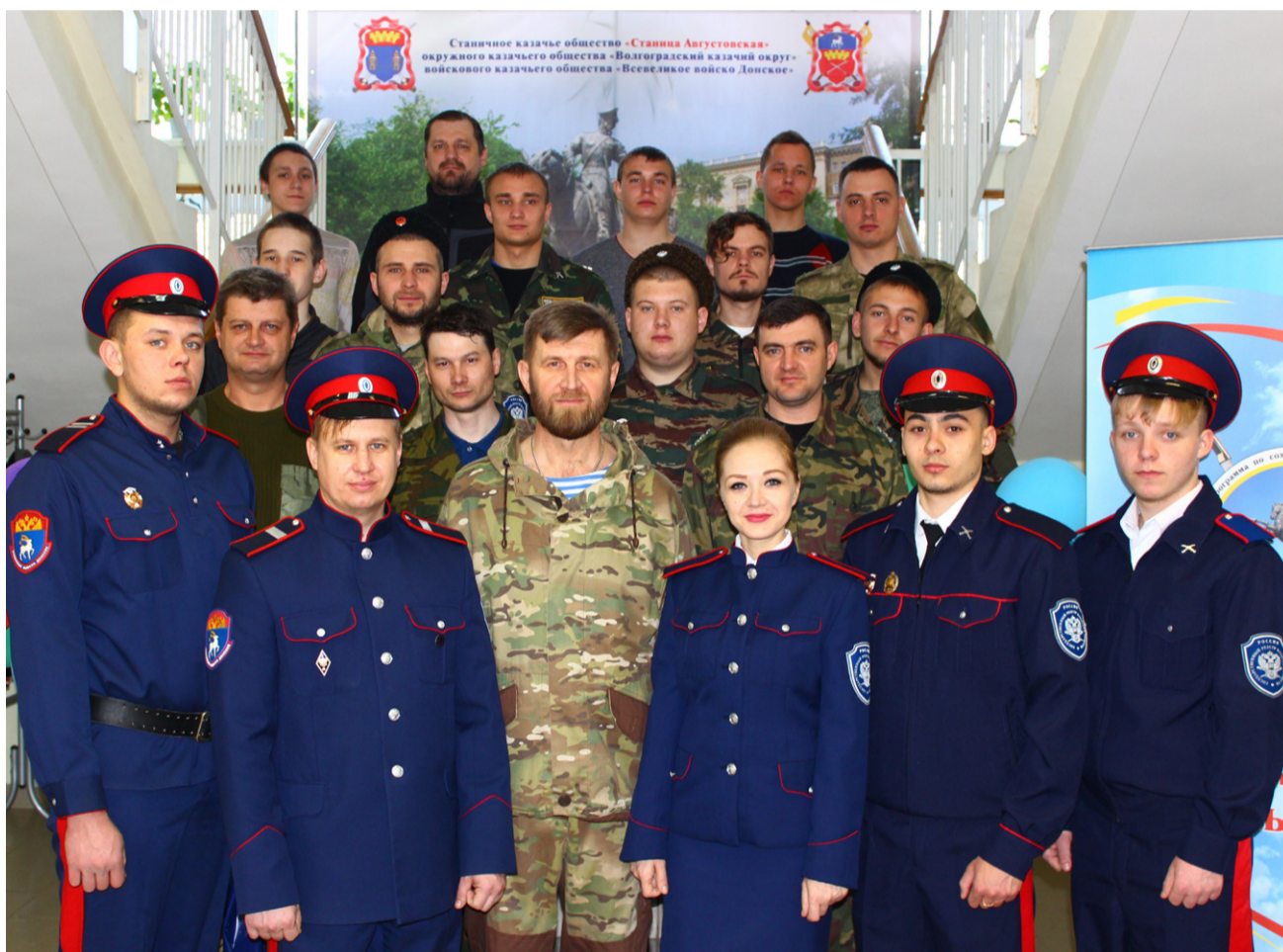
Организаторы и участники «Школы молодого атамана»

В Волгограде на базе муниципального учреждения «Городской оздоровительный центр для детей и молодежи «Орленок» с 31 марта по 2 апреля прошли сборы молодых казаков – весенний курс «Школы молодого атамана» – региональный проект, учредителями и организаторами которого выступили станичное казачье общество «Станица Августовская» и ГКУ «Казачий центр государственной службы». Участие в сборах приняли 25 казаков в возрасте от 18 до 30 лет из Усть-Медведицкого, Хоперского, Второго Донского и Волгоградского казачьих округов Всеволожского войска Донского.