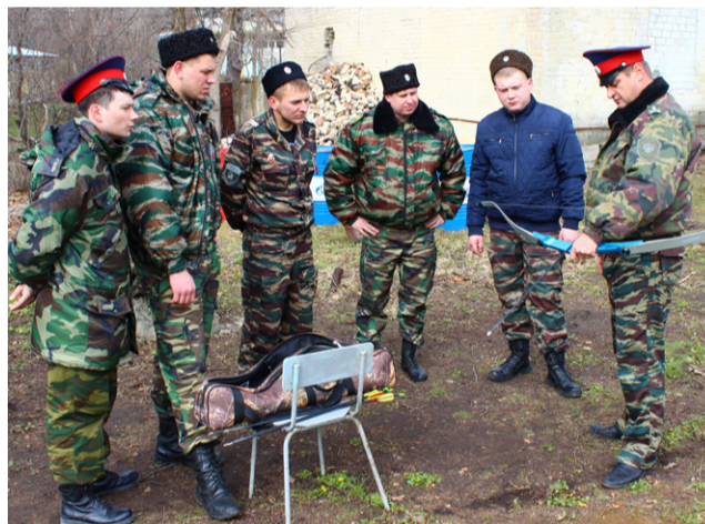
Мастер-класс по стрельбе из лука