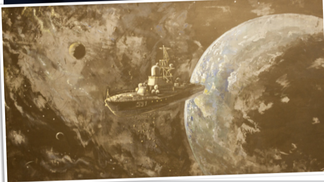
«МРК - Ливень»