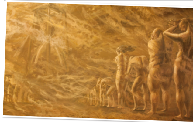
«Зря прожитые люди» (фрагмент)

да совпадает со зрительским восприятием моих мыслей и идей. Такое чувство, будто холст концентрирует в себе энергию художника и передает ее зрителю.