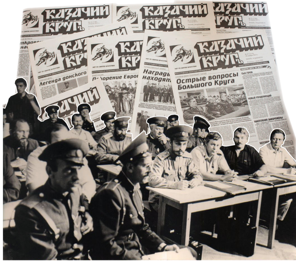
Волгоград, 1993 год. Правление Волгоградского округа Донских казаков

многие из которых до сих пор сохранили преданность газете. На местах, во многих населённых пунктах области, появились постоянные внештатные корреспонденты, распространители и даже активисты, устраивавшие публичные чтения газеты перед казаками и казачками во время встреч и общественных мероприятий.