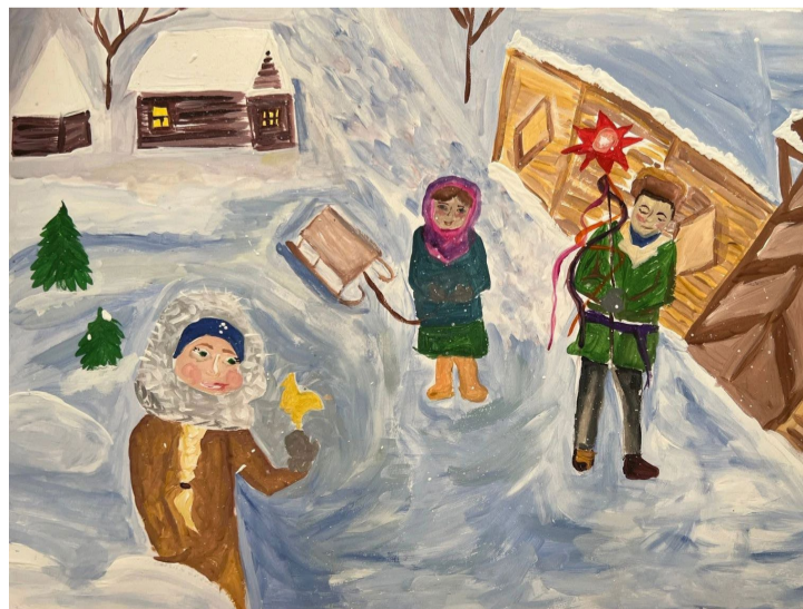
Рисунки Шашковой Евгении (внизу)