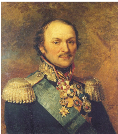
Портрет Матвея Платова работы художника Джорджа Доу. Военная галерея Зимнего Дворца, Государственный Эрмитаж (Санкт-Петербург)

Есть тут одно обстоятельство, которое можно назвать простым совпадением. Но совпадением – символическим. Именно в день рождения Платова был назначен главнокомандующим русскими войсками генерал-фельдмаршал граф М.И. Кутузов, ставший, выража-