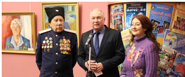
Окончание. Начало на 1-й стр.

Волгоградский музыкально-драматический казачий театр представил современное прочтение пьесы Константина Симонова. Действие спектакля в постановке главного режиссера театра Владимира Тихонравова происходит в военном Сталинграде. В спектакле показан путь обретений и потерь, ошибок и достижений обыкновенного парня. Герои спектакля – это собирательный образ поколения, вынесшего на своих плечах тяготы войны, показанный через судьбы врачей, актеров, музыкантов, командиров и солдат.