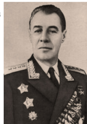
Генерал армии Маркиан Попов

Вот так мы, земляки героической, масштабной личности, героя, генерала Маркиана Попова, благодаря кинематографистам, много узнали об этом забытом полководце Великой Отечественной войны. Так будем достойны героя!