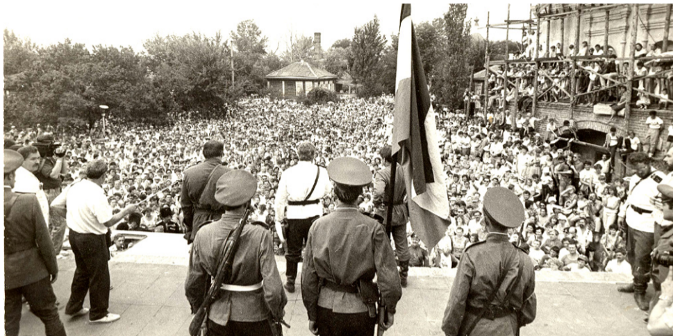
На снимке из фондов Музея истории донского казачества: Круг Старочеркасской станицы. 1990 год