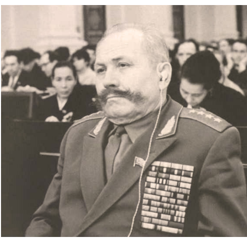
Генерал армии С.М. Штеменко на сессии Верховного Совета РСФСР

Советский военный деятель, начальник Генерального штаба Вооружённых Сил СССР с 1948 по 1952 годы, начальник Главного разведывательного управления ГШ ВС СССР в 1956-1957 годах, генерал армии.