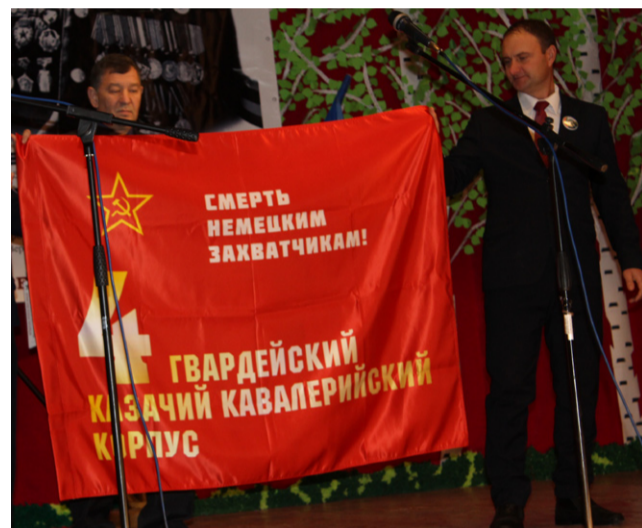
Делегация осетин вручает Даниловскому району копию боевого знамени