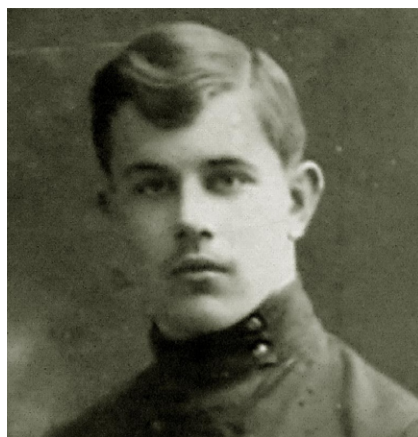
предположительно 1917 год

Базой проведения олимпиады были общеобразовательные учреждения города Котельниково, где их руководители создали все необходимые условия для организованного ее проведения. Муниципальный этап всероссийской олимпиады проводился по 16 учебным предметам. По итогам рейтинговых протоколов, на этом этапе олимпиады приняли участие 254 человека из 7-11-х классов, а общее количество участников – 466. Победителями стали 33 человека, а призерами – 151 человек. Ребятам набравшим максимальное количество баллов по предметам, ждёт региональный этап всероссийской олимпиады школьников.