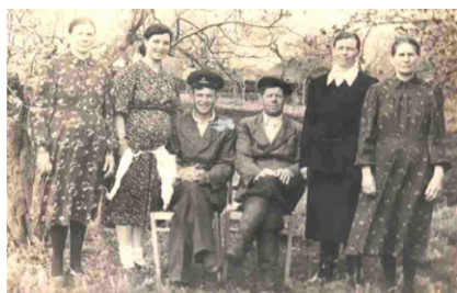
Фетисовцы славятся своим добродушным нравом