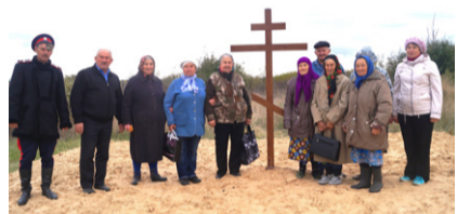
Бывшие хуторяне снова встретились